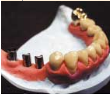
Unten: Individuelle Titan-implantat-Abutments (45, 46, 47)