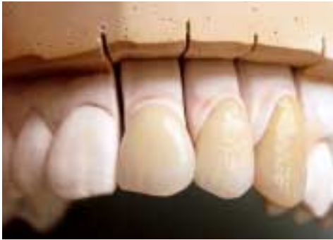
Keramikkronen im Frontzahnbereich

SERVICE UND INTERDISZIPLINÄRE KOMMUNIKATION sind für uns keine Fremdworte, sondern praktizierte Vision und Motivation gleichermaßen.