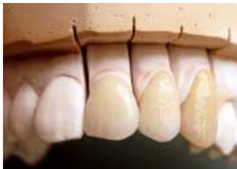
Keramikkronen im Frontzahnbereich

SERVICE UND INTERDISZIPLINÄRE KOMMUNIKATION sind für uns keine Fremdworte, sondern praktizierte Vision und Motivation gleichermaßen.