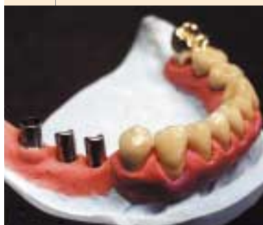
Unten: Individuelle Titanimplantat-Abutments (45, 46, 47)